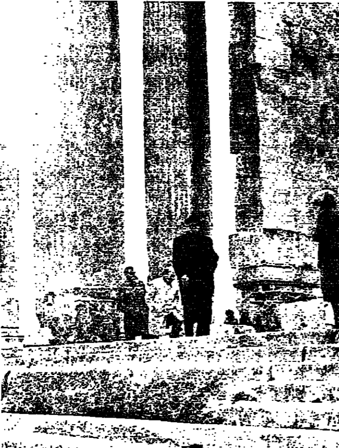
ادغار غور بين الامعة الضخمة في قلعة بعلبك

تقول ان التزامات اخرى قد تكون مؤثرة في سامات الخطر على لبنان ، ويجب ايضاحها وتجديد الالتزامات بها ، اذا كانت مستمرة ، ورفضها ضمن نية واضحة ومطلقة او سرية . ولا ننسى في هذا الموضوع مدى تلغز موقف القوى اللبنانية ، وفي طليعتها موقف الكتائب .